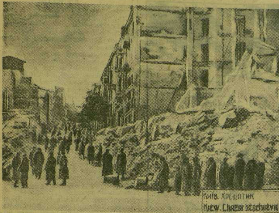
Киев. Крещатик Kiev. Cherschtschyk