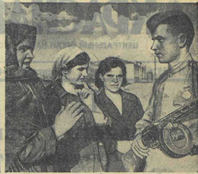
В НОВОРОССИЙСКЕ. На снимках: 1. Командир 11-й Новороссийской штурмовой авиационной дивизии Герой Советского Союза подполковник Губрий. 2. Разрушенный немцами Новороссийский порт. 3. Боец беседует с жителями заводского поселка.