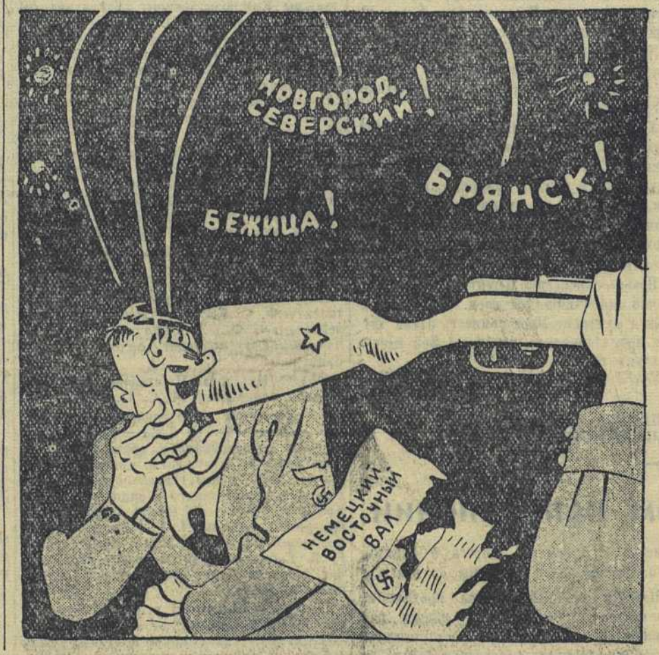
Рис. Бор. Ефимова.